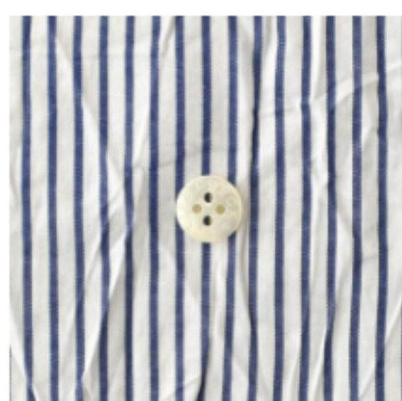
ホワイト×ブルー 細