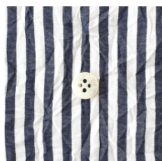
ネイビー×ホワイト