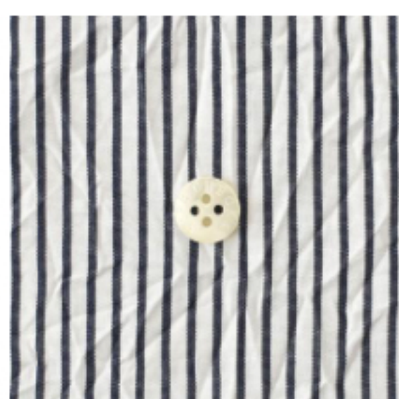
ホワイト×ネイビー 細