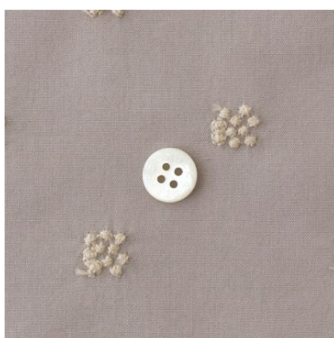
あずきミルクにピンクベージュ