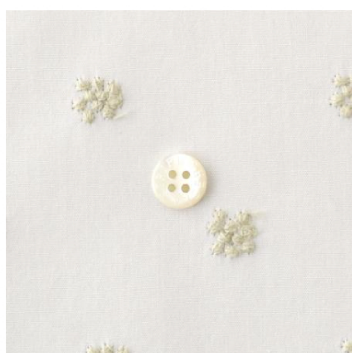
ホワイトにミストホワイト