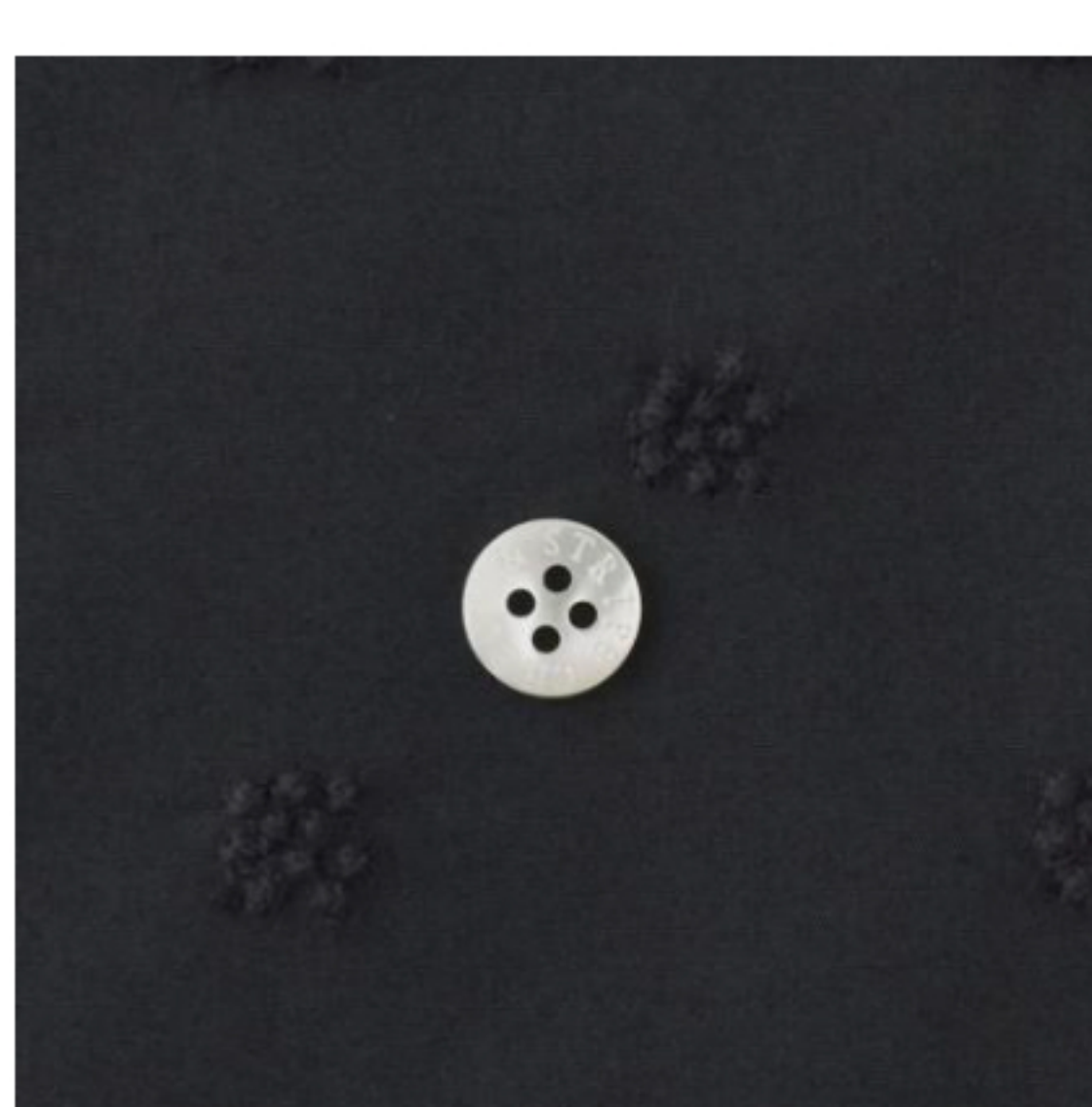
木いちごにカーボングレー