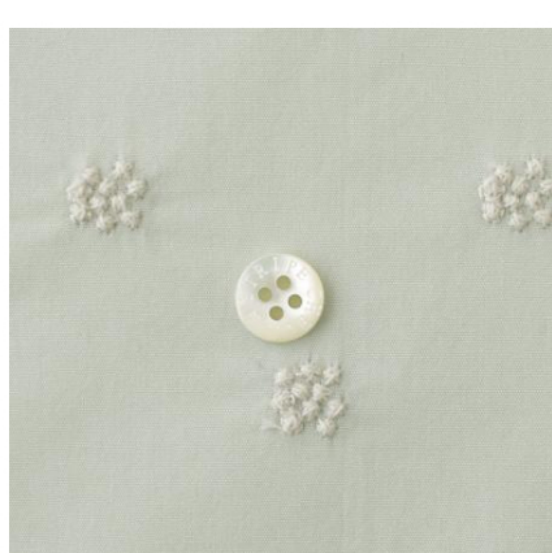
ミンティーにシルバーグレー