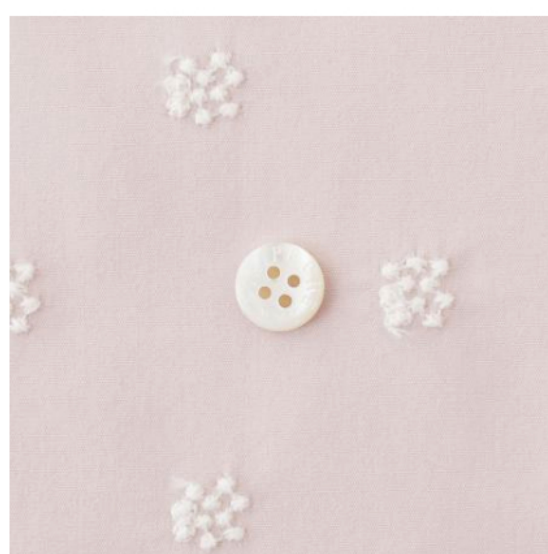
グレイッシュピンクにライトピーチ