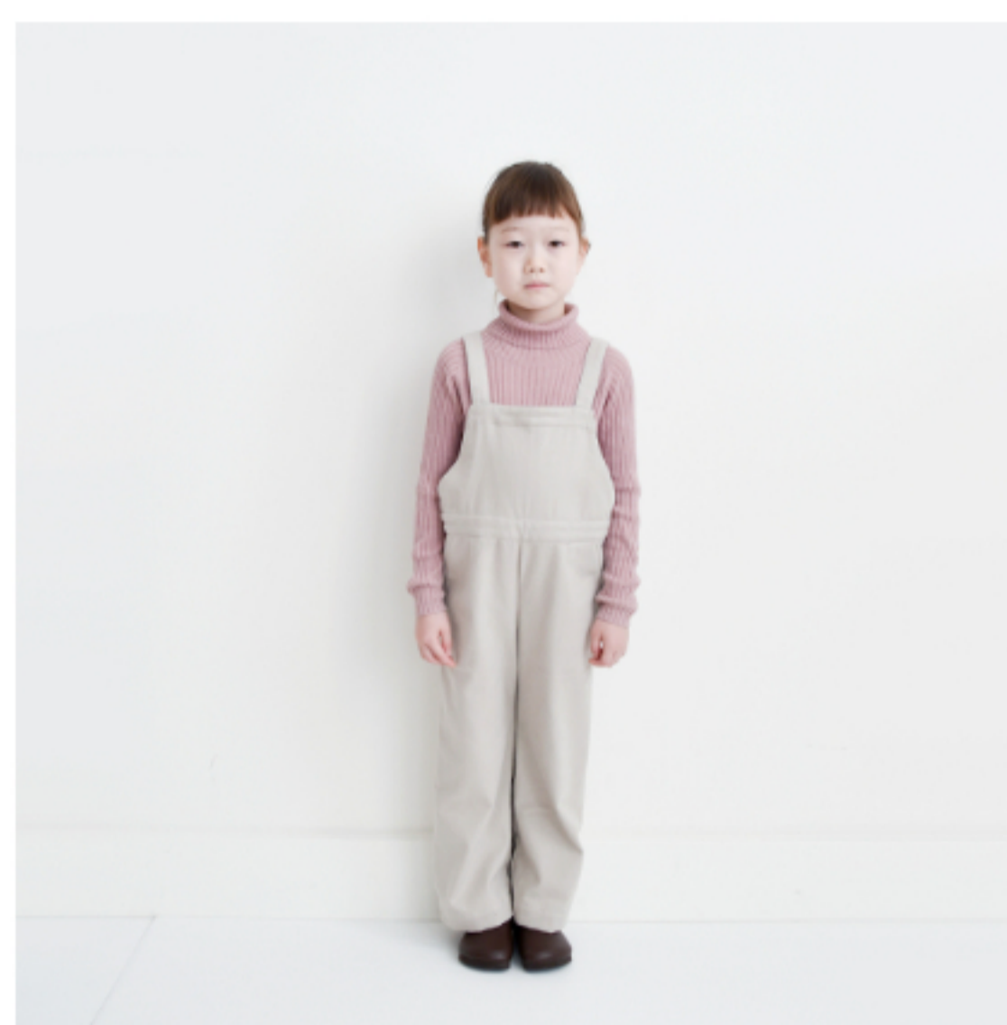
ソイラテ:『CHECK&STRIPEの子ども服 ソーイング・ナーサリー』(文化出版局) デイリーオーバーオール