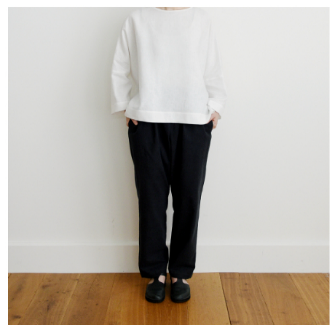
木いちご:『CHECK&STRIPE SEW HAPPY』(世界文化社) デイリーパンツ