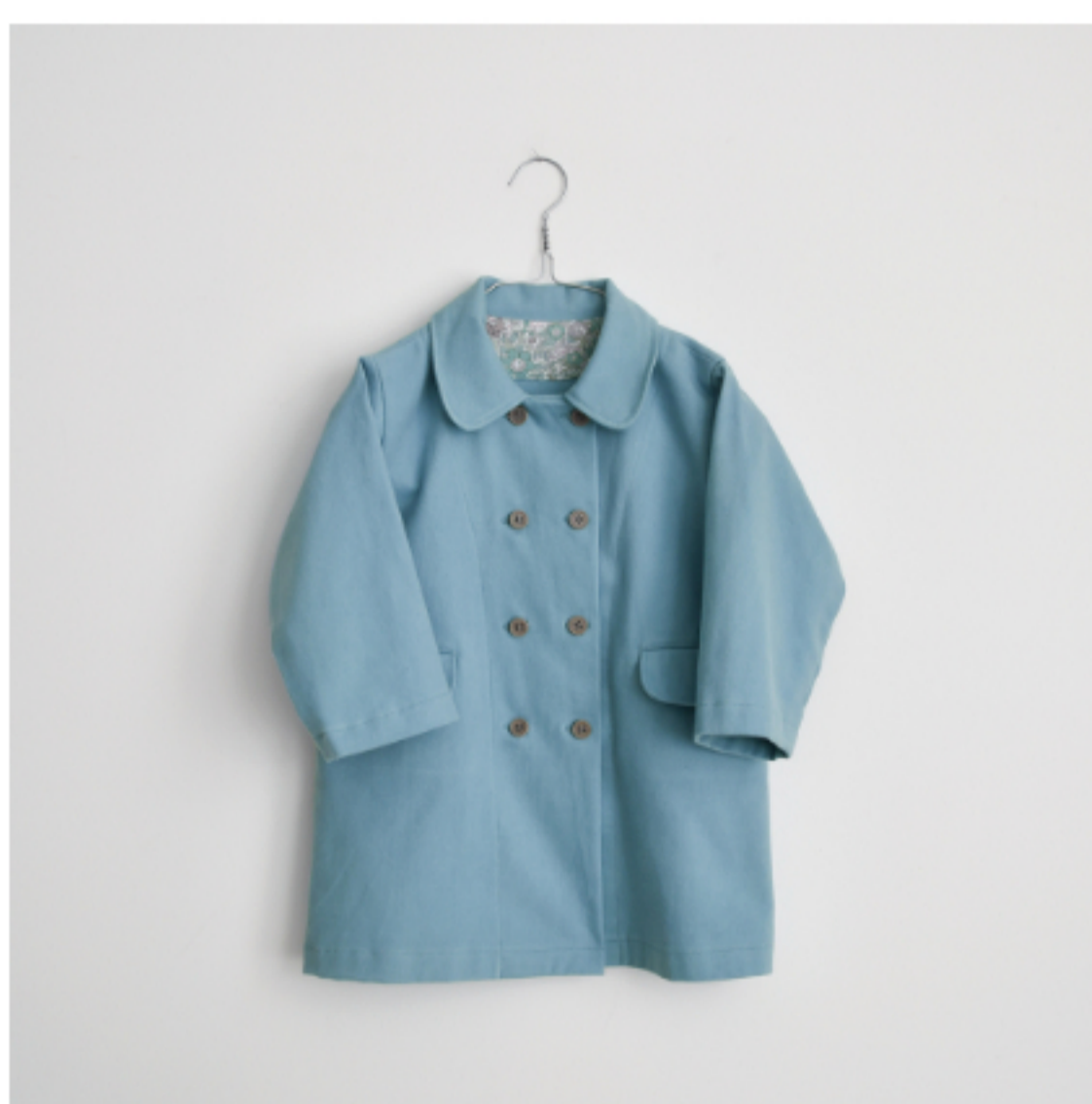
フォゲットミーノット:「パターン28」コート