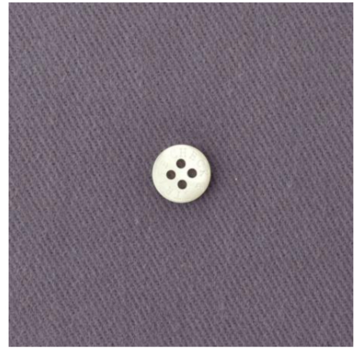
グレイッシュラベンダー