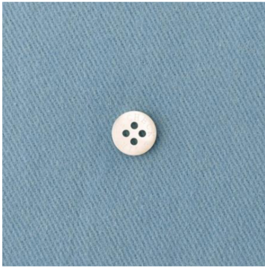
フォゲットミーノット