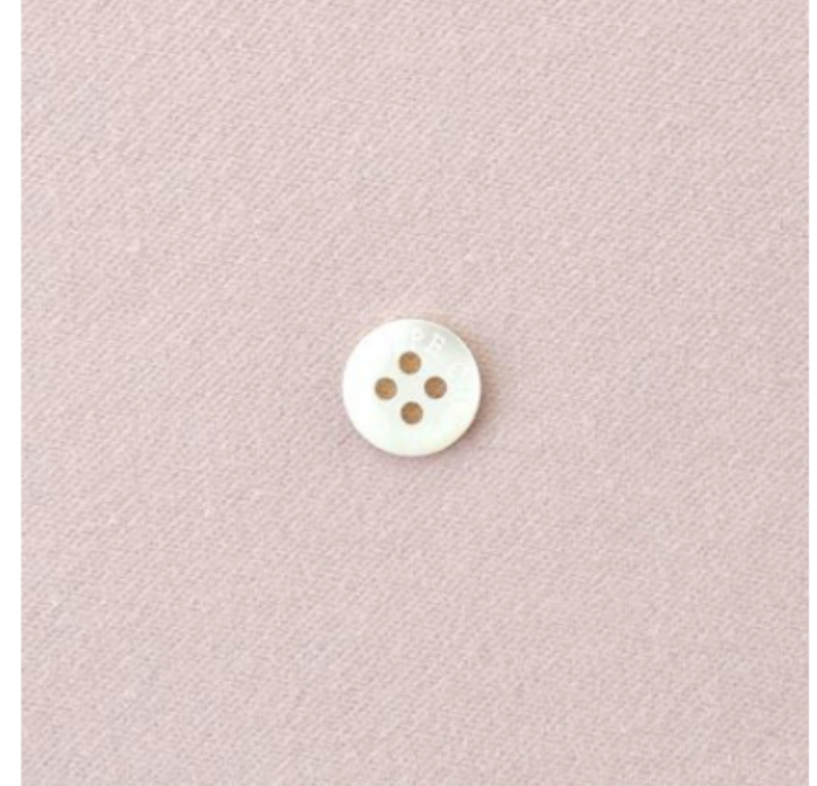
グレイッシュピンク