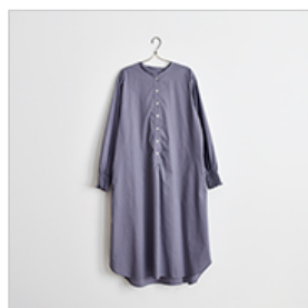
176(スタンドカラーのワンピース)