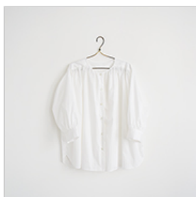
175(七分袖のギャザーブラウス/ワンピース)