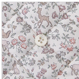
◎J20C(フレンチカラー系)