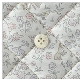
◎J22D(ラベンダー・ピンク系)(新色)