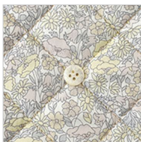
◎J22A(ライトベージュ系)