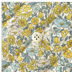
◎J22D(マスタード・グリーン系)