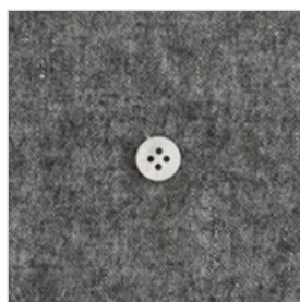
チャコールグレー