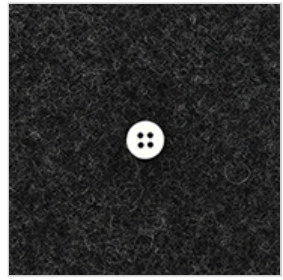
チャコールグレー