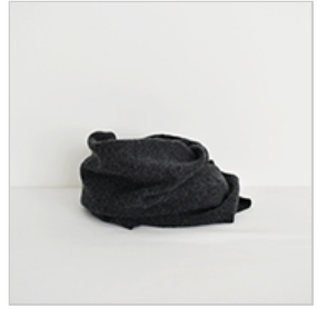
チャコールグレー