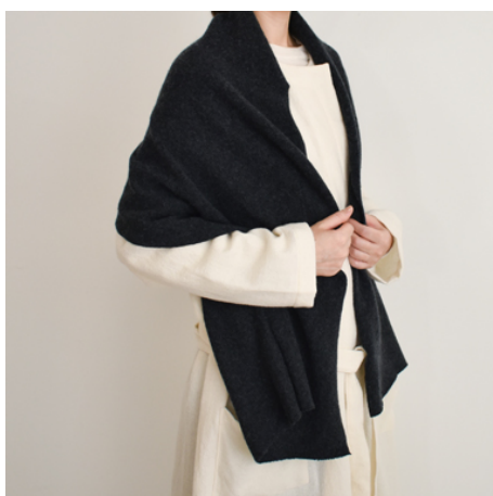
チャコールグレー