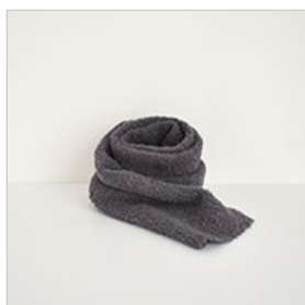
チャコールグレー