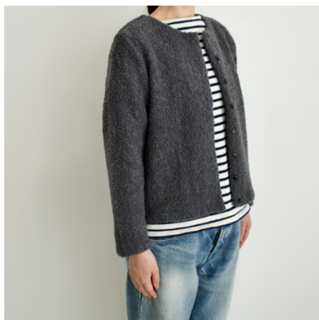
チャコールグレー:「 パターン173 」 ※用尺: M 1.2m、L 1.3m