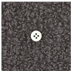
チャコールグレー