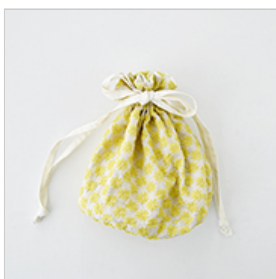
マッシュルームにイエローのセット