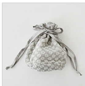
ストーンにパールグレーのセット