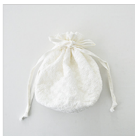
ホワイトにオフホワイトのセット