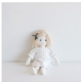
マーガレットのセット