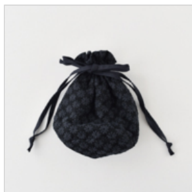
ブラックにチャコールのセット