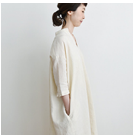
ヴァニニュー:『CHECK&STRIPE SEW HAPPY』(世界文化社) スキッパーワンピース