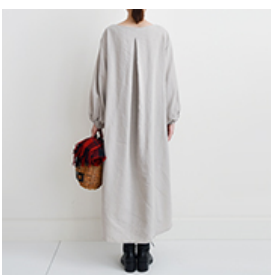
グレイージュ:『CHECK&STRIPEのおとな服 ソーイング・レメディ―』(文化出版局) パルーンスリーブのワンピース ※袖を10cm伸ばしたアレンジをしています。用尺:S 3.6m/M 3.6m/L 3.7m