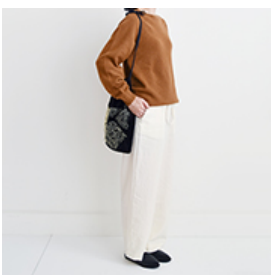
ヴァニニュー:『CHECK&STRIPEのおとな服 ソーイング・レメディ―』(文化出版局) フローラルパンツ