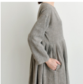
奎ブラウン:『CHECK&STRIPE my favorite 私の好きな服』(主婦と生活社) タックワンピース