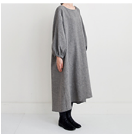
グレー:『CHECK&STRIPEのおとな服 ソーイング・レメディ―』(文化出版局) パルーンスリーブのワンピース ※袖を10cm伸ばしたアレンジをしています。用尺:S 3.6m、M 3.6m、L 3.7m